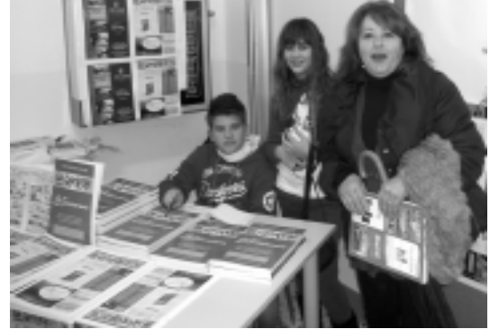
Il banchetto di vendita del volume

La Graticola, sia nella manifestazione per i Dodici anni di S...PIFFERO. Esso è dato in omaggio a quanti sottoscrivono un abbonamento al giornale o acquistabile mediante una libera offerta al Comitato.