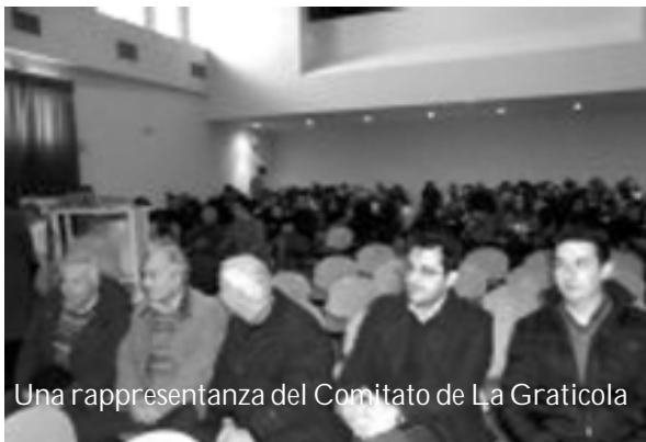
Una rappresentanza del Comitato de La Graticola