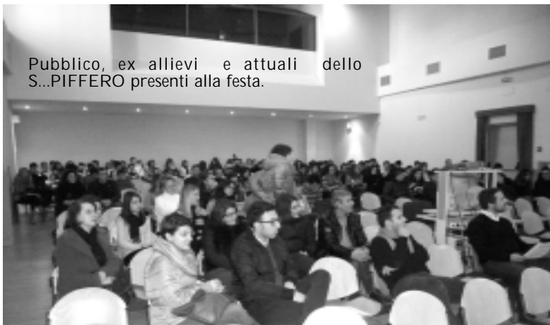
Pubblico, ex allievi e attuali dello S...PIFFERO presenti alla festa.